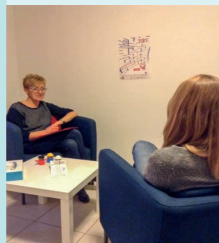
Een therapeut aan het werk in het Tejohuis, Stationslaan 14 te 8200 Brugge